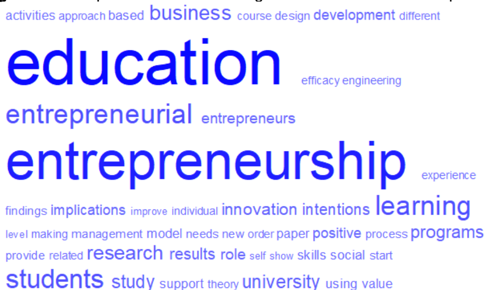
Figura 2. Principales áreas de investigación en la educación emprendedora.